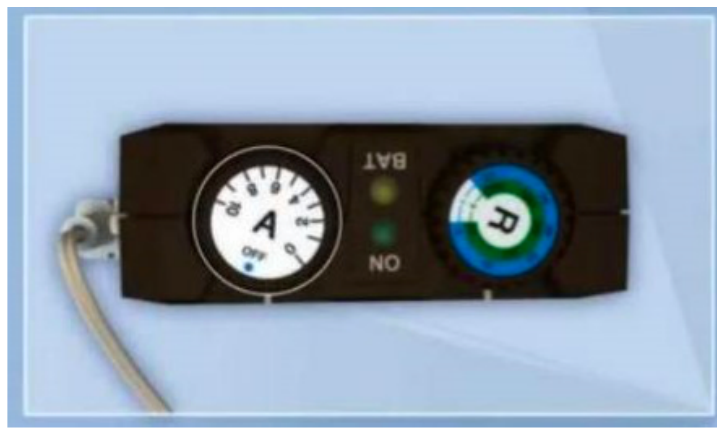
1: Links: de verbindingkabel in het besturingskastje steken. Rechts: bovenaanzicht van de tijdelijke stimulator.

Laat het stroompje oplopen totdat u de prikkeling voelt (zoals tijdens de ingreep). Dit doet u door aan de knop te draaien met daarop in het midden de letter 'A'. Als het witte streepje onder de draaiknop gelijk staat met het cijfer '0' staat het stroompje op 0 Volt ingesteld enzovoorts. Als het blauwe stipje met de letters 'OFF', gelijk staat met het witte streepje staat de stroom uit. De andere knop met de letter 'R' is meestal afgeplakt, hier hoeft u zelf niets aan te veranderen.