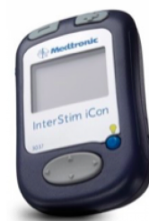
1. De afstandsbediening.