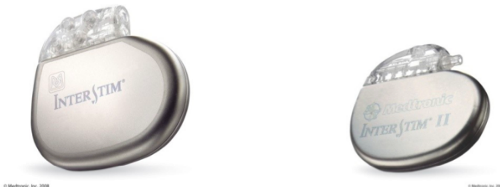
2. Twee verschillende soorten neuromodulatoren, links de InterStim en rechts de InterStim II. © Medtronic, Inc

Let op!: Is bij u een neuromodulator geplaatst? Dan gelden wél nog steeds de 'beweegregels' zoals niet bukken, tillen enzovoorts gedurende ongeveer twee extra weken (zoals tijdens de testperiode).