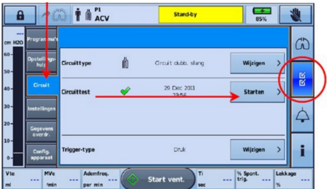
Afbeelding 4. Circuittest/slangentest