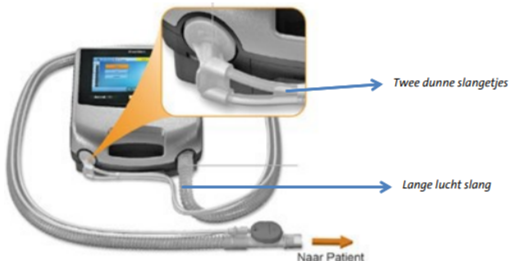
Afbeelding 3 Aansluiten slangen

Schuif het ene uiteinde van de lange slang over het tweede cilindervormige aansluitpunt bovenop de bevochtiger; schuif de twee dunne slangetjes die aan de lange slang vastzitten over de twee nippels links vooraan bij het beademingstoestel. Op het andere uiteinde van de lange slang zit een ronde grijze uitademingsklep. Op deze klep wordt de swivel aangesloten. De klep dient om de uitgeademde lucht weer naar buiten te laten via één van de twee dunne slangen. De tweede dunne slang dient om de druk in het systeem te meten.