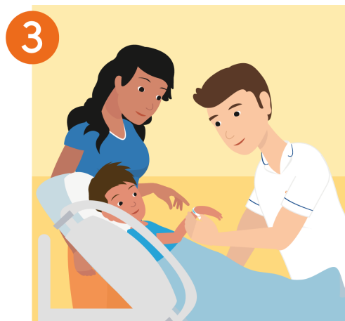
Bespreek de behandeling of opname