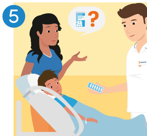
Controleer de medicijnen van uw kind