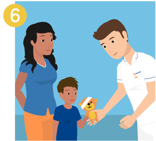
Volg de instructies goed op