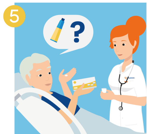
controleer uw medicijnen