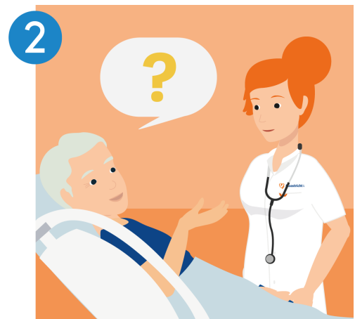
Stel uw vraag