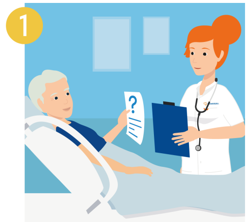
Informeer uw zorgverlener