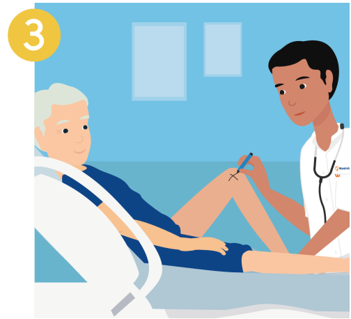
markeren van de operatie plek