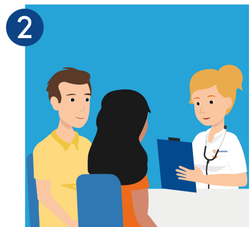
Geef de juiste informatie

Het is belangrijk dat u de zorgverlener al uw gezondheidsklachten vertelt. Om te komen tot een juiste diagnose en behandeling heeft de zorgverlener deze informatie nodig. Vertel welke klachten u heeft, wanneer ze voorkomen en hoe lang u er last van heeft.