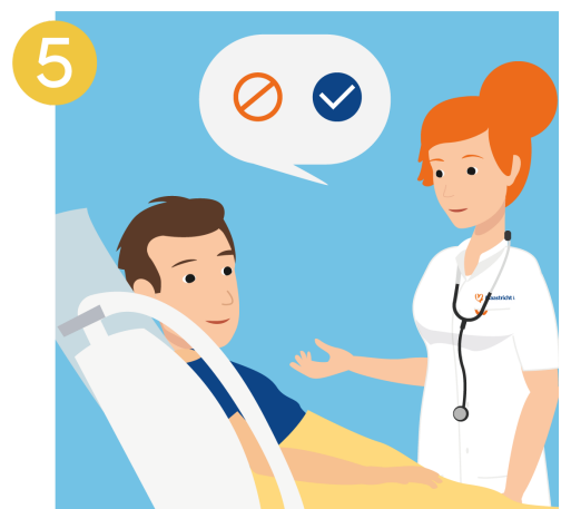
Houd u aan de afspraken

Houd u aan de afspraken die u met de zorgverlener maakt over uw behandeling. Vraag wat u wel of niet mag doen. Krijgt u voor uw gevoel tegenstrijdige adviezen of informatie laat dit uw zorgverlener weten.