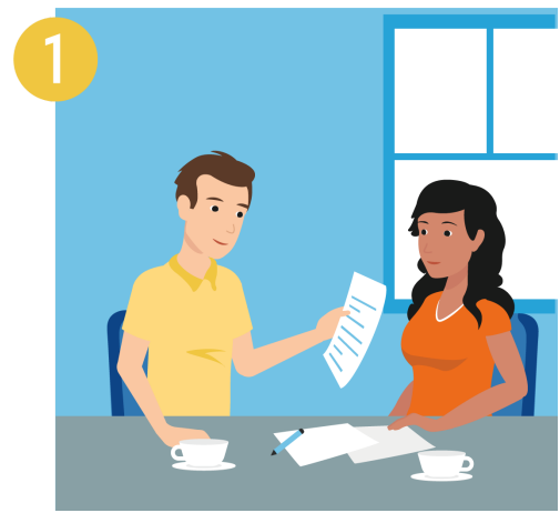
Bereid u voor