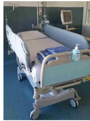
Afbeelding 3. Bedhoezen

Om uw epileptische aanval goed te registreren, wordt u tijdens uw opname met behulp van een camera 24 uur per dag gefilmd en geregistreerd. Deze registratie wordt overdag de hele tijd door een gespecialiseerd laborant van de afdeling klinische neurofysiologie (KNF) beoordeeld.